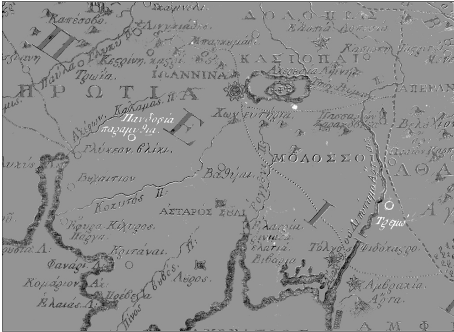
Εικ. 1: Ψηφιακή διαφάνεια (λεπτομέρεια), μέσω της οποίας εντοπίστηκαν το 2008 οι διαφορές των δύο τύπων Α και Β της Χάρτας του Ρήγα Βελεστινλή

και τα γνωστά στο εξωτερικό (π.χ. Λονδίνο, Παρίσι, Στοκχόλμη, Βιέννη). 32 Επιπλέον, η συνέχιση της έρευνάς μας απέδειξε ότι εντοπίζονται ακόμη και μικρές παραλλαγές στις δύο κύριες τυπολογίες, όπως είναι π.χ. το αντίτυπο του Καπεσόβου, το οποίο αποτελεί παραλλαγή του πρώτου τύπου! 33